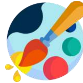
Человек- Художественный образ (ЧХ)

Экономика Банковское дело Информационные технологии Лингвистика