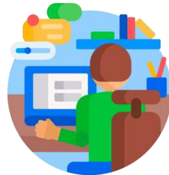
Заочная с ДОТ